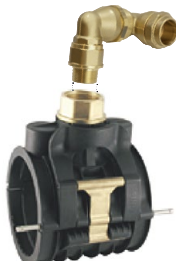
160 mm Anbörningsbygeln, RSK nr 250 65 63 med 2" rörgänga, RSK nr 250 65 67 och vridbar dubbel- vinkel typ 229 , 63 x 2", NRF nr 256 30 93.